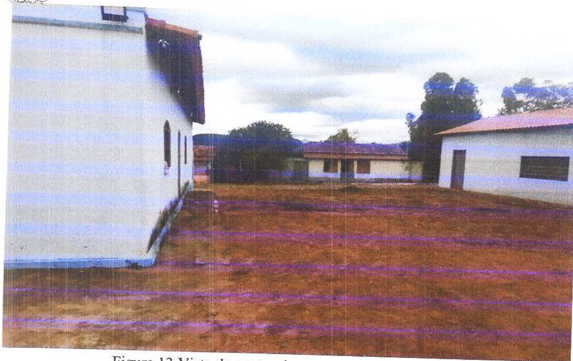
Figura 13 Vista do centro da praça para a Rua traseira.

Fonte: Acervo pessoal Acesso em: 20/03/2020.