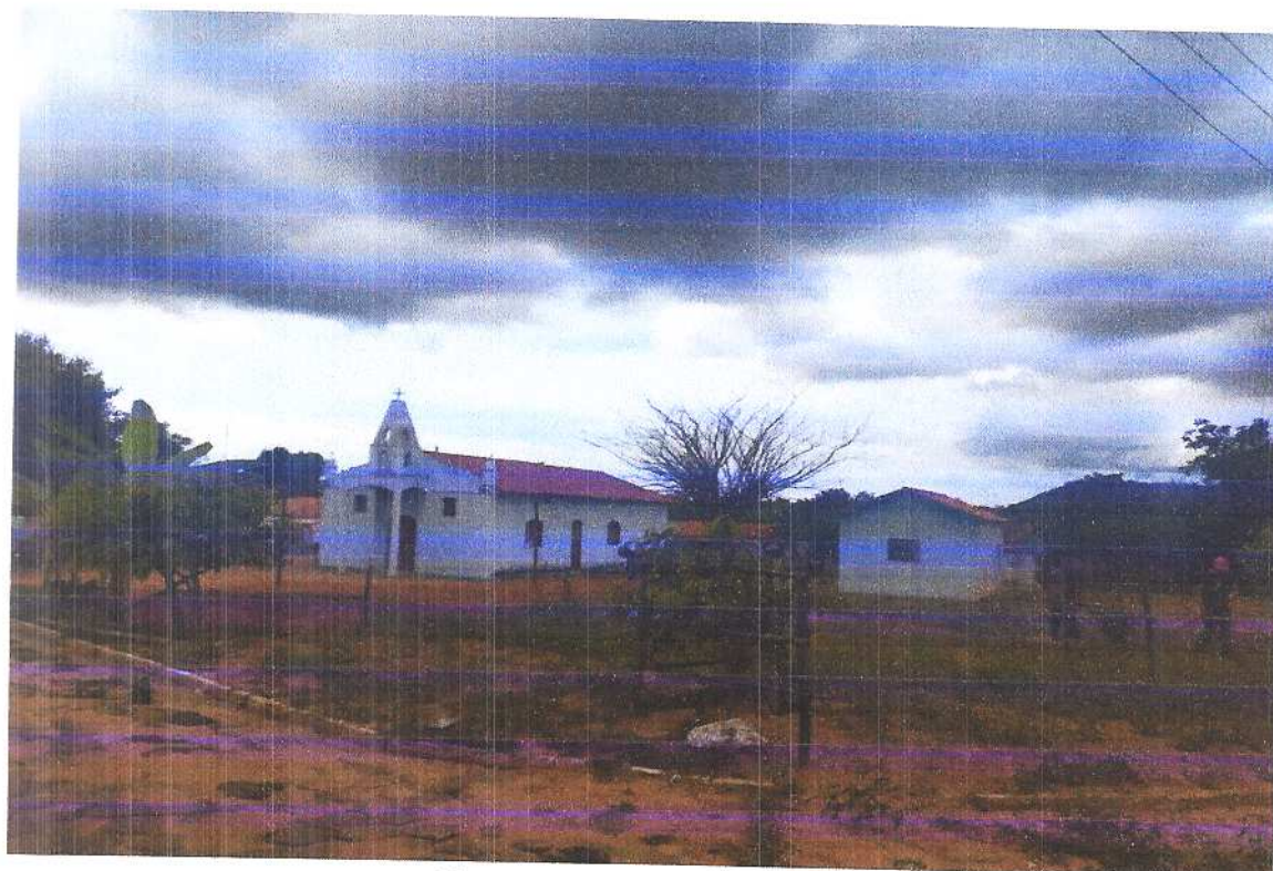
Figura 10 Vista isométrica 4.

Fonte: Acervo pessoal Acesso em: 20/03/2020.