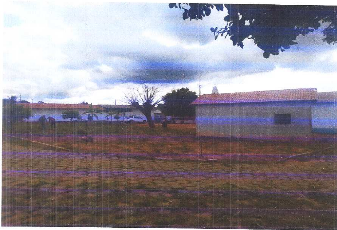
Figura 8 Vista isométrica 3. Fonte: Acervo pessoal Acesso em: 20/03/2020.