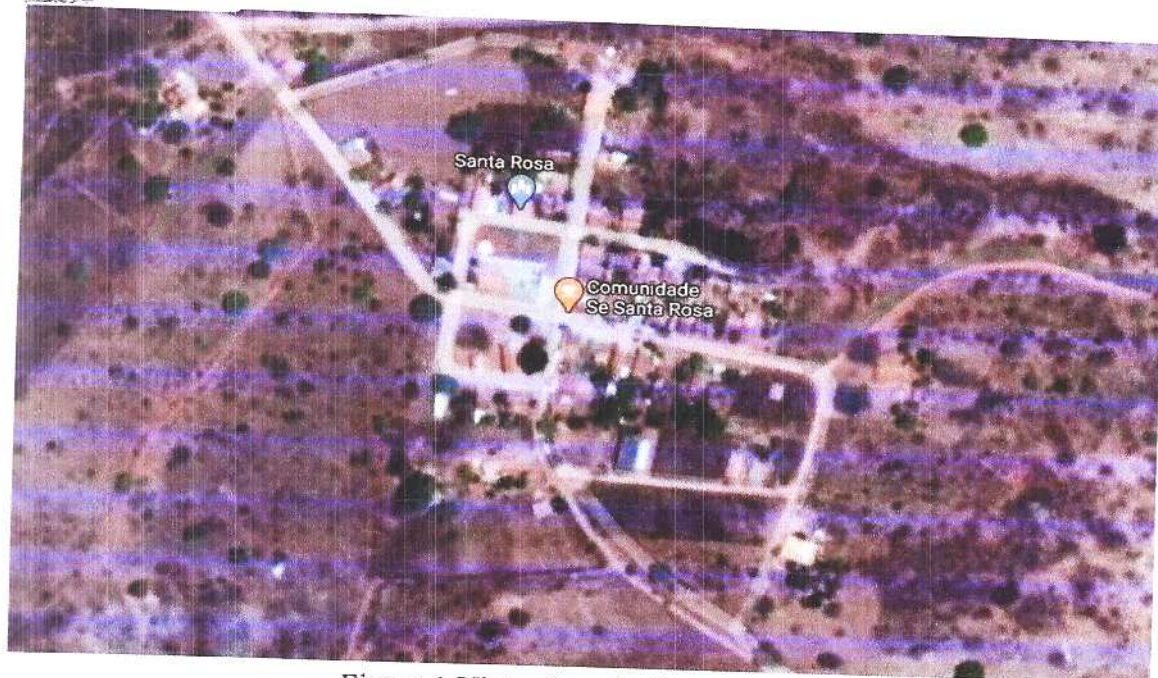
Figura 1 Viste aérea da Comunidade.