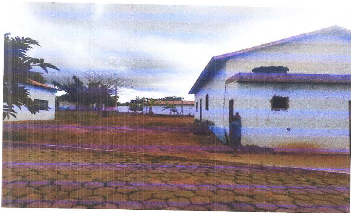
Figura 16 Vista traseira 4. Fonte: Acervo pessoal Acesso em: 20/03/2020.