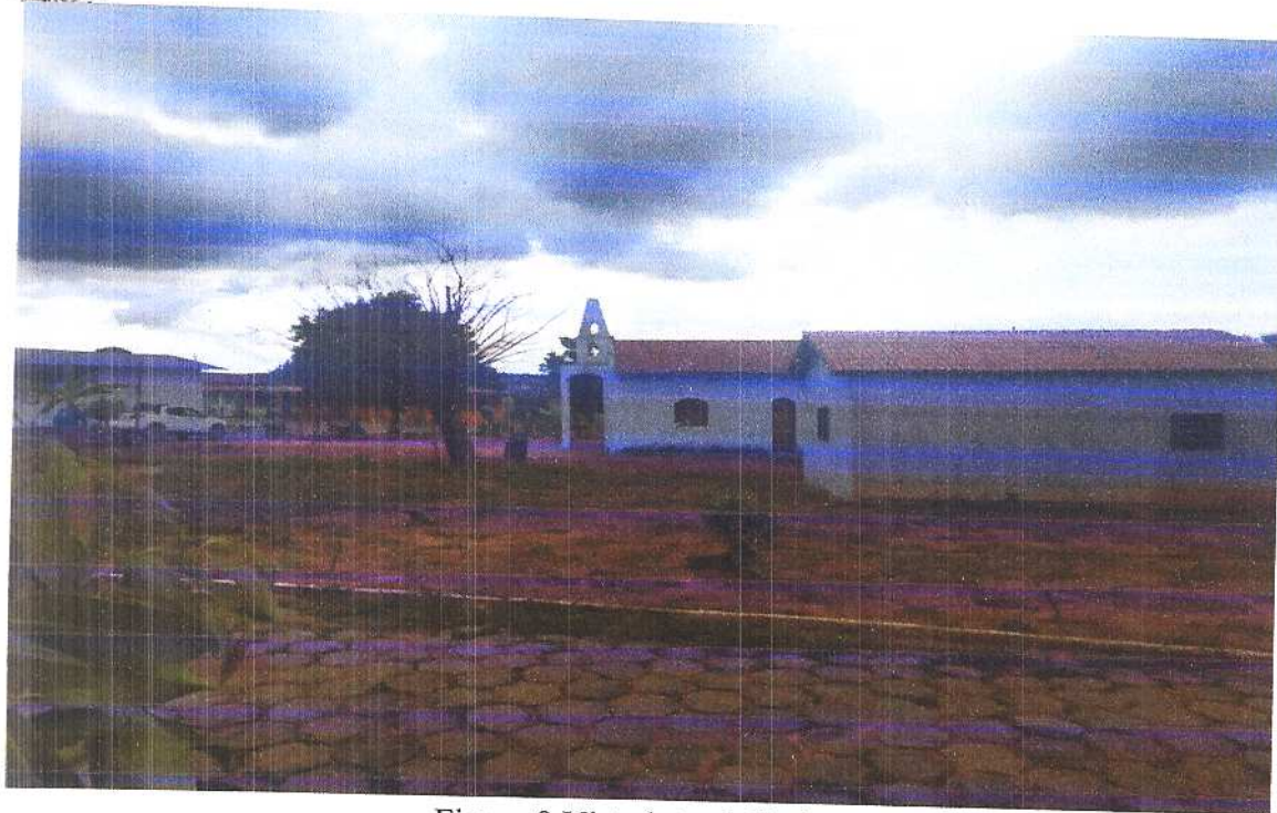
Figura 9 Vista lateral direita.

Fonte: Acervo pessoal Acesso em: 20/03/2020.