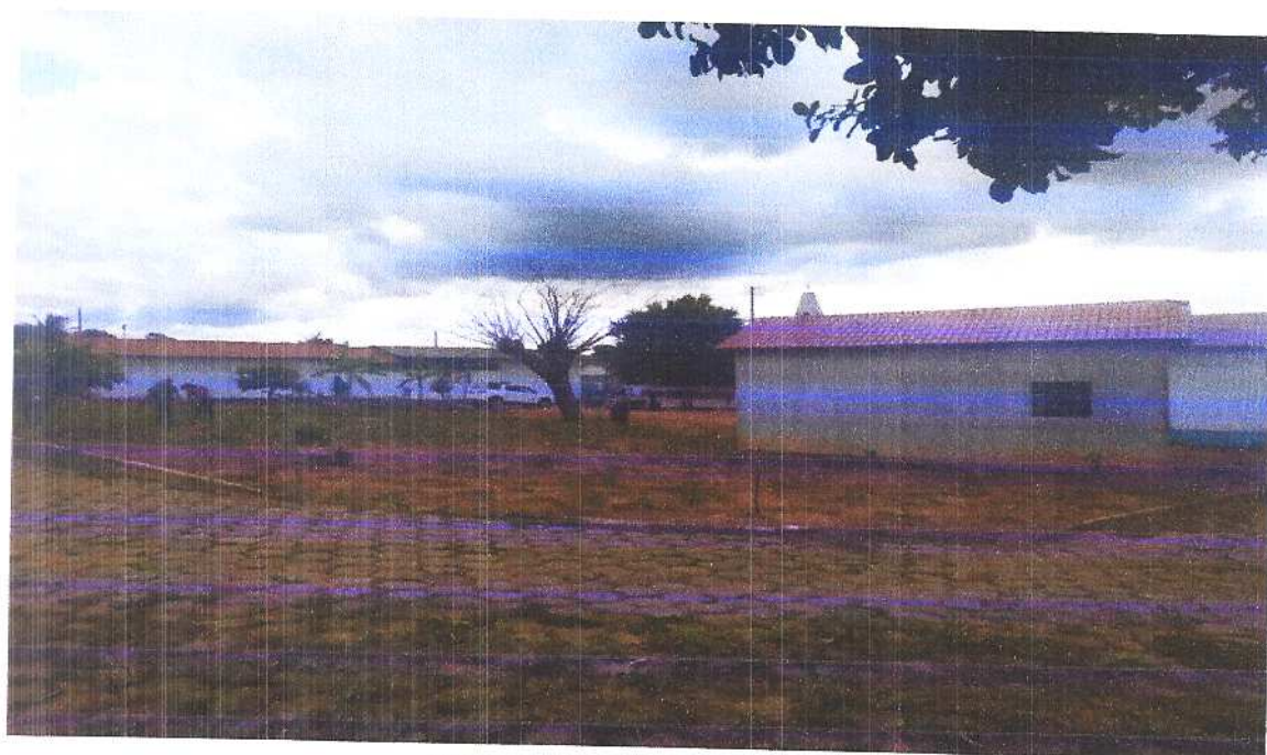
Figura 18 Vista isométrica 7.

Fonte: Acervo pessoal Acesso em: 20/03/2020.