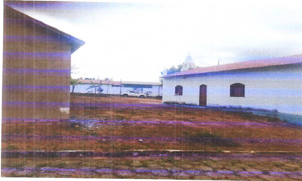
Figura 7 Vista traseira 2. Fonte: Acervo pessoal Acesso em: 20/03/2020.