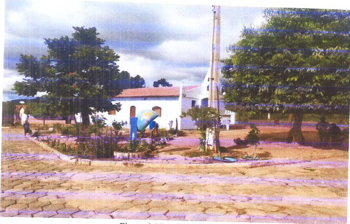
Figura 3 Vista isométrica 1.