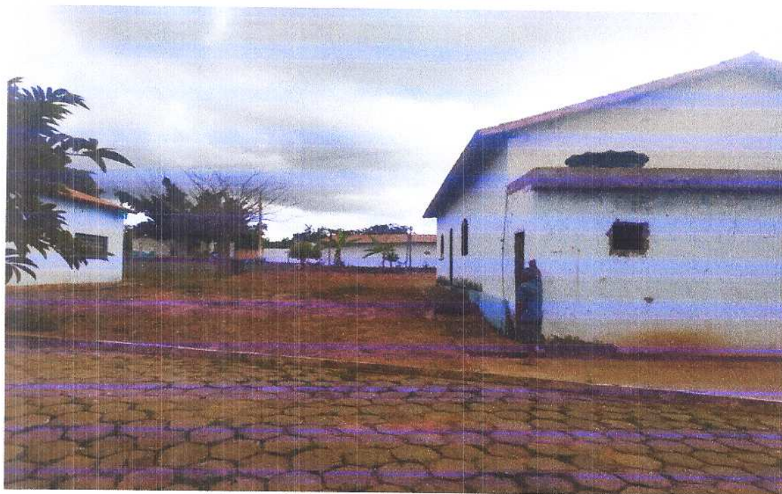
Figura 6 Vista traseira 1.