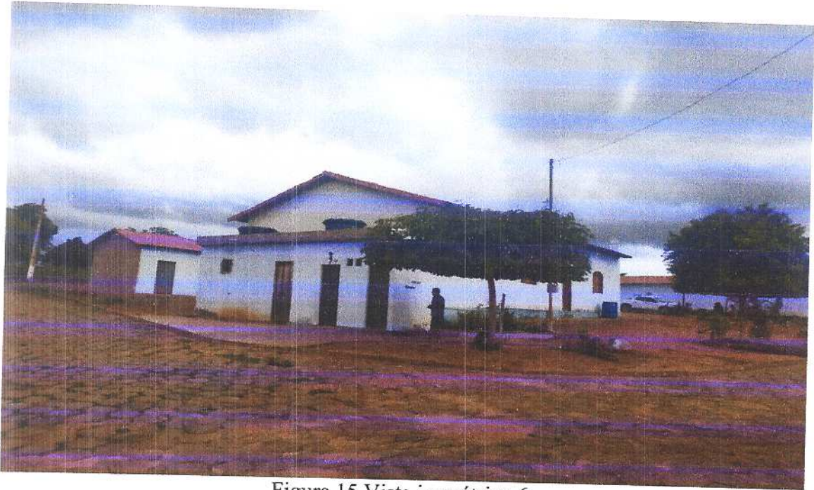
Figura 15 Vista isométrica 6. Fonte: Acervo pessoal Acesso em: 20/03/2020.