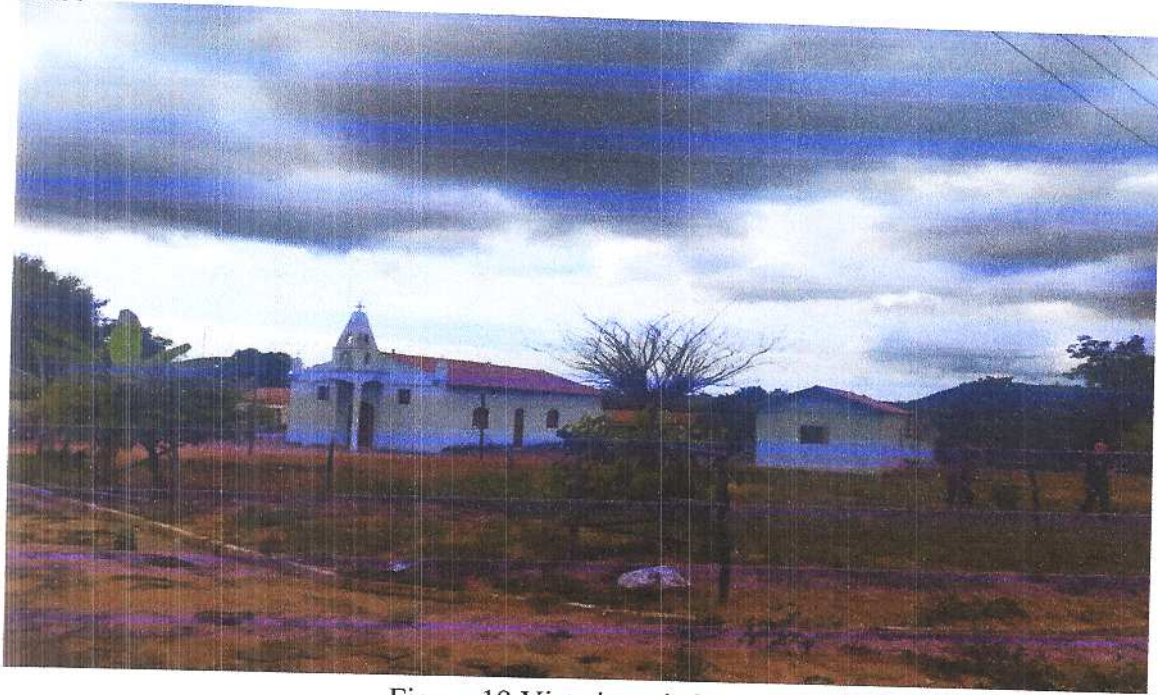
Figura 19 Vista isométrica 8. Fonte: Acervo pessoal Acesso em: 20/03/2020.