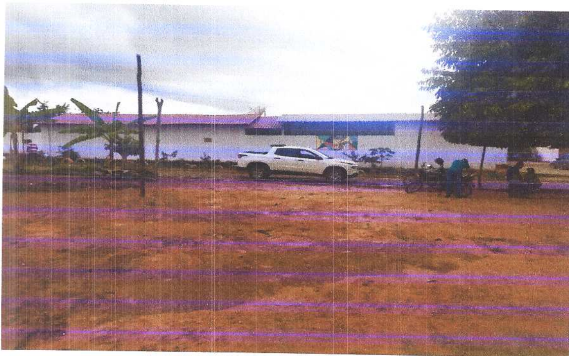
Figura 12 Vista do centro da praça para a Rua frontal. Fonte: Acervo pessoal Acesso em: 20/03/2020.