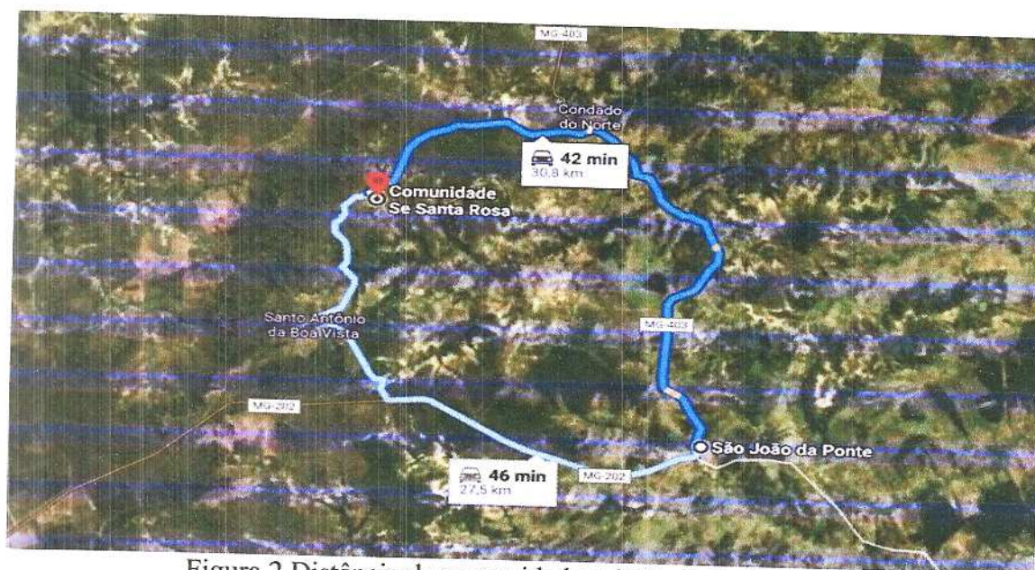
Figura 2 Distância da comunidade até São João da Ponte.