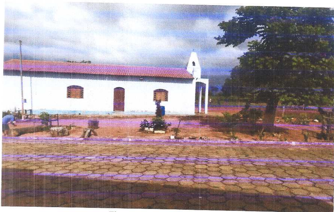
Figura 4 Vista lateral esquerda. Fonte: Acervo pessoal Acesso em: 20/03/2020.