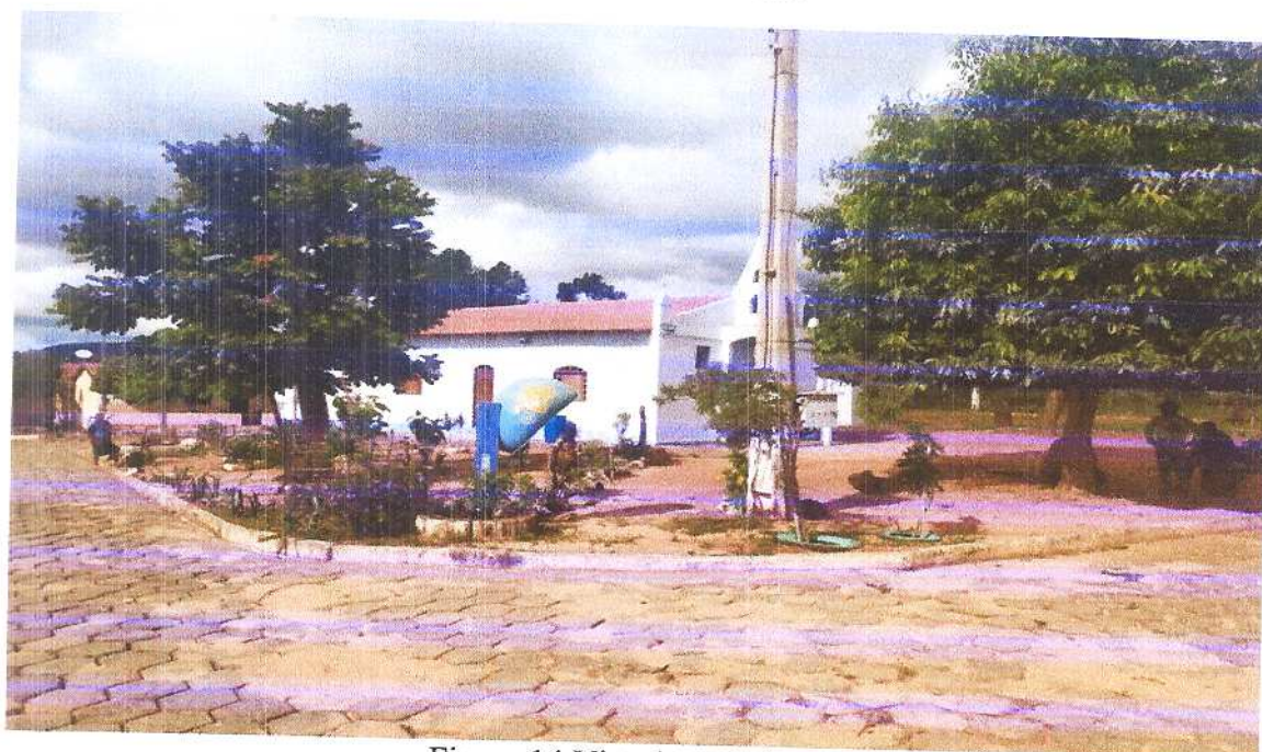
Figura 14 Vista isométrica 5.

Fonte: Acervo pessoal Acesso em: 20/03/2020.