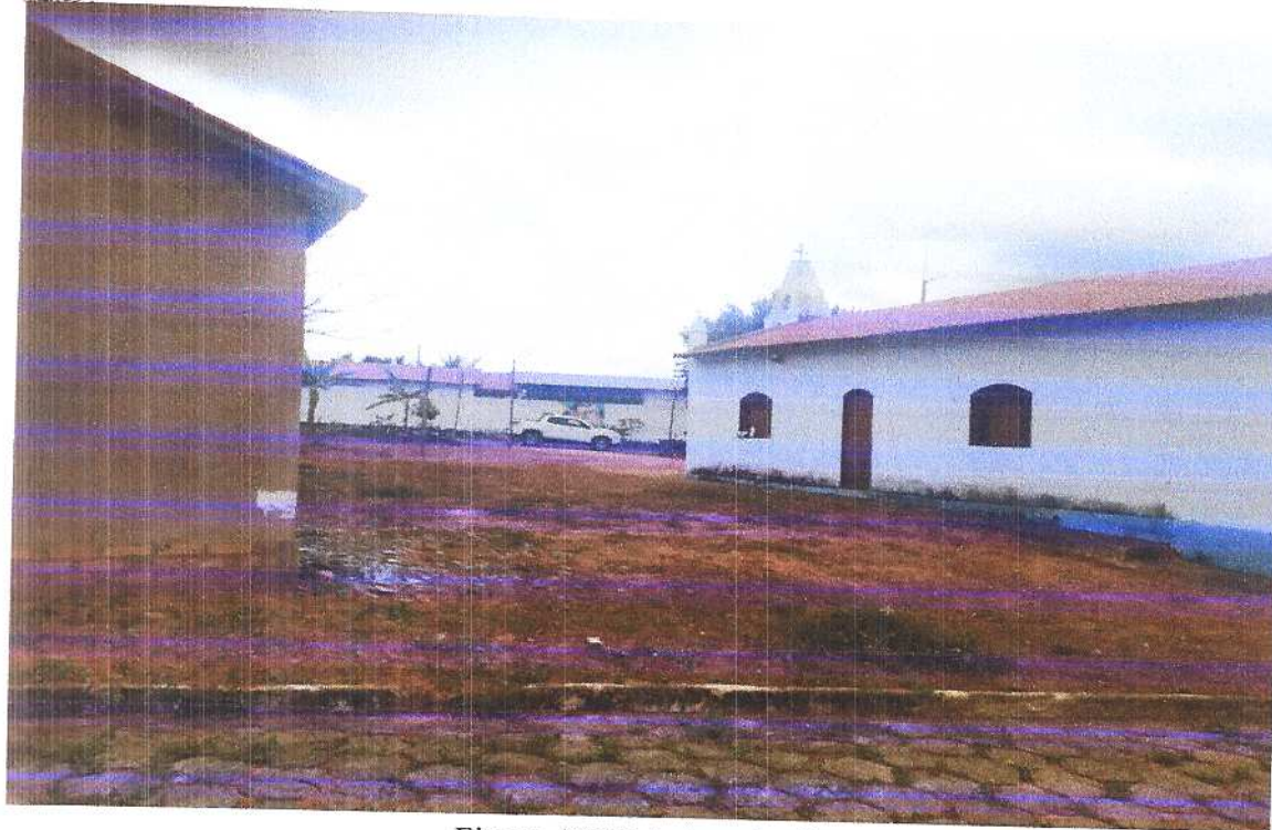
Figura 17 Vista traseira 2.

Fonte: Acervo pessoal Acesso em: 20/03/2020.