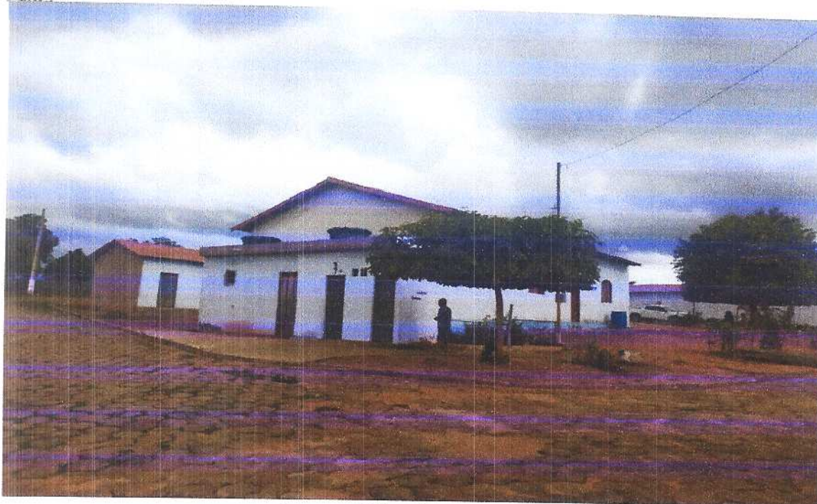
Figura 5 Vista isométrica 2.

Fonte: Acervo pessoal Acesso em: 20/03/2020.